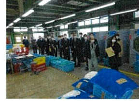
刑務所・少年院 スタディツアー