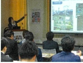
雇用支援セミナー